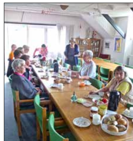
Nederst: Efter en god gang motion samles medlemmer af Handicapafdelingen til socialt samvær over en kop kaffe og en bid brød.