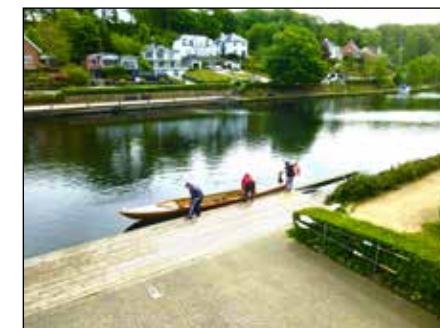
Hjem igen - efter et par liggende timer på Silkeborgsøerne.