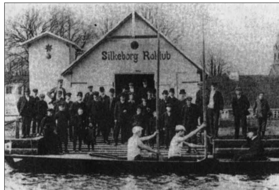
Øverst: Stort fremmøde ved Silkeborg Roklubs første bus, der stod færdig i 1891.