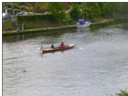
De første åretag på formiddagens rotur.

Roklubben er stiftet i 1890 og er dermed Silkeborgs andenældste forening, kun Skytteforeningen har en længere historie. Det er samtidig en af Danmarks ældste roklubber, så det er en klub med store og stolte traditioner, SMK-nyt besøger denne gang.