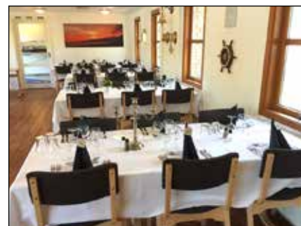
Splinternye stole og borde giver restaurantens gæster en hjertelig velkomst.

SMK benyttede en lidt forlænget vinterlukning af restauranten til at få givet køkkenet på Indelukkets Spisested en tiltrængt renovering. Samtidig er der anskaffet nye borde og stole til restauranten, så lokalerne nu står lyse og indbydende for de mange gæster, der finder frem til Indelukkets Spisested.