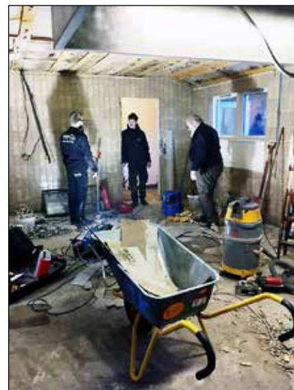
Køkkenet blev renoveret helt i bund.