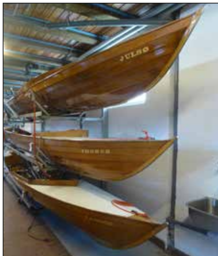
Omhyggelig pleje og vedligehold er hemmeligheden, der holder robåde i god stand år efter år.

For de mange roere, der nøjes med mindre ambitioner for deres sport, byder roklubben på et væld af tilbud. Det gælder ikke kun faciliteterne i klubhuset - og i Søsportens Hus ved Langsø, hvor især kaproerne hører til. Silkeborgsøerne giver nemlig i sig selv en masse muligheder, som andre roklubber kigger misundeligt efter.