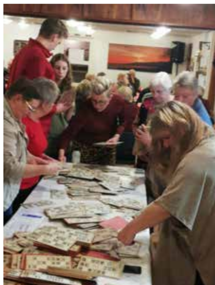
Valget af plade er en svær og omstændelig proces.

SMK's julebanko er lig med tradition, samvær, hygge, god mad og et væld af præmier. Ikke sært, at det hvert år trækker mange af huse.