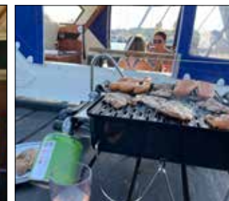
Hannehygge i Svendborg.

En hyggesnak på Dunkær Kro med gode sejlervenner fra Silkeborg.