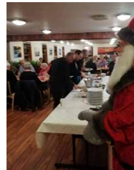
Til traditionen hører også, at man spiser sig godt mat i Harrys flæskesteg, inden det går løs med spillepladerne.

Pizza Milano Red Office SMK Indelukkets Spisested Bluebay Marine.