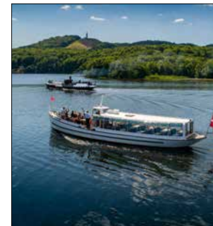
Hjejlebådene er et af de mest markante kendetegn i miljøet i og omkring Silkeborgsøerne.

- Da jeg i sin tid sagde ja til jobbet som direktør i Hjejleselskabet, var det drevet af, at jeg kunne mærke det der stik i hjertet, som min lærer på Kornmod lærte mig at kende. Vi står på skuldrene af en vigtig historie og har taget en række vigtige skridt for at bevare relevansen for de kommende generationer. Min arbejdstitel var ”fra afvikling til udvikling”, da jeg startede, og jeg er så stolt af, hvor langt vi er kommet. Vi er ikke i mål, men forudsætningerne og fundamentet er skabt. Det er menneskeligt meningsfuldt arbejde hver eneste dag. Det vil for evigt være dybt forankret i mig som menneske og en del af den, jeg er.