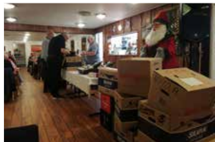
Gevinsterne til det amerikanske lotteri er linet op ved dommerbordet.

udvalgte brikker på gulvet, eller der sker noget andet uventet, men i samarbejde - og med god hjælp fra de opmærksomme bankospillere - bliver spillet afviklet til alles tilfredshed.