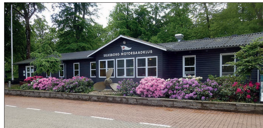
Da Indelukkets Spisested åbnede efter coronapausen, stod rododendronplanterne i bedet foran i fuldt flor.