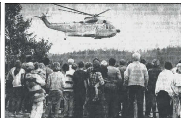
Redningsdemonstrationen ved De Små Fisk tiltrak masser af publikum, såvel på land som ombord på de hundreder af både, der var sejlet op ad åen.