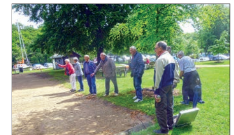
Petanquespillerne synes godt om den nye bane i Indelukket.

Petanquebanen er blevet flyttet over på den anden side af vejen, så der nu kastes og trilles kugler på en nyindrettet bane. Banen stod klar til forårets dystre, og den formiddag, SMK-nyt lagde vejen forbi, var det tydeligt, at petanquefolket har taget godt imod de nye faciliteter.