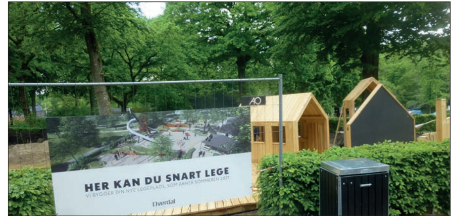
Superlegepladsen bliver helt færdig i løbet af sommeren.

Legepladsen i Indelukket har i foråret været under forvandling til ikke mindre end en ny superlegeplads , som står klar til at tage imod børn og barnlige sjæle i Indelukket.