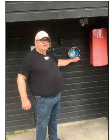
Flydesparren, der skal bruges ved olieudslip, befinder sig i dette PVC-rør, bygget ind i huset ved benzintanken i Indelukket.