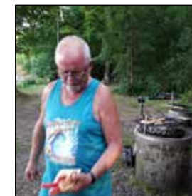
Fotos fra Frikadellekonkurrencen.