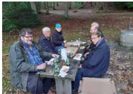
Der holdes en lille, men tiltrængt pause under arbejdet med besigtigelse af broerne.

Brosamarbejdet mellem Silkeborg Sejlklub (SSK), Ry Bådlaug (RB) og Silkeborg Motorbådklub (SMK) så dagens lys i 1988. Man indgik aftalen for de 34 anløbsbroer, som klubberne hver især havde lejet på offentlige arealer, mens de grunde, som klubberne selv ejer, ikke var med, det gjaldt f.eks. SMK's grunde ved Sejs og Himmelbjerget. Kirsebærgrunden ved Julsø var i mange år lejet af SMK, men i de senere år er også Ry Bådlaug kommet med i den aftale, så medlemmerne fra begge klubber nu kan benytte den. Formålet med Brosamarbejdet blev ved etableringen beskrevet således: