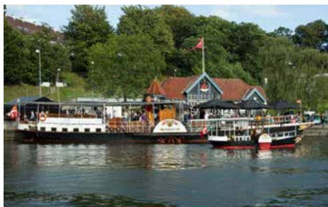
Ved Silkeborg IldfestRegatta 2017 fik Hjejlen besøg i havnen af sin juniorudgave, der ellers normalt holder til i Bollingsø.