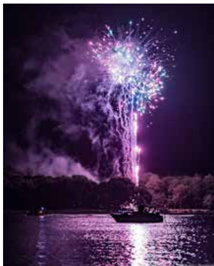
Fyrværkeristemning ved De Små Fisk.