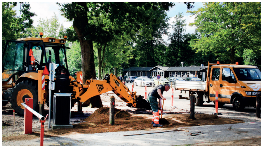
Kort efter sommerferien gik kommunens folk i gang med arbejdet i Indelukket.

Og så vil jeg ellers stoppe formandsordene for denne gang og lade det ”nye” blad og dets indhold tale for sig selv.