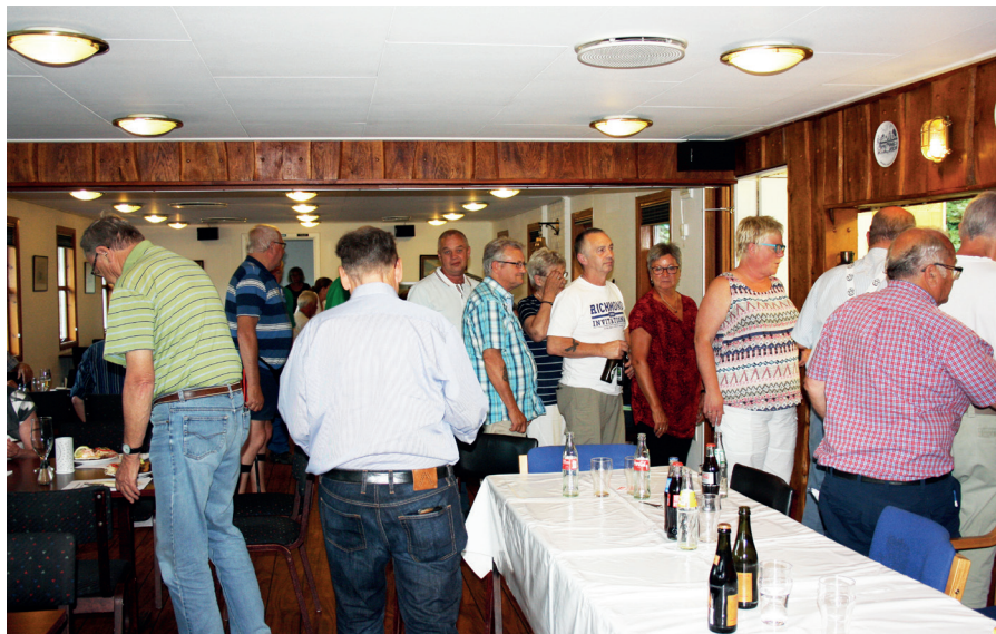
Det er godt med en pause ind i mellem, når generalforsamlingerne trækker ud...

indkaldte til endnu en generalforsamling, så man med tre måneders forsinkelse kunne få behandlet den resterende del af den dagsorden, der blev suspenderet tilbage i marts måned.