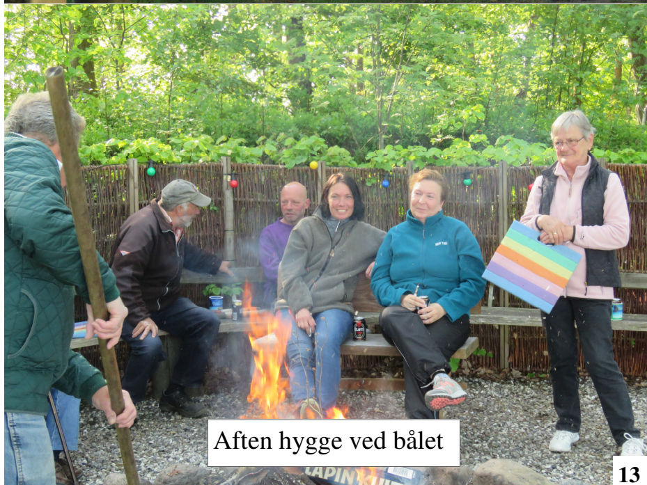
Aften hygge ved bålet