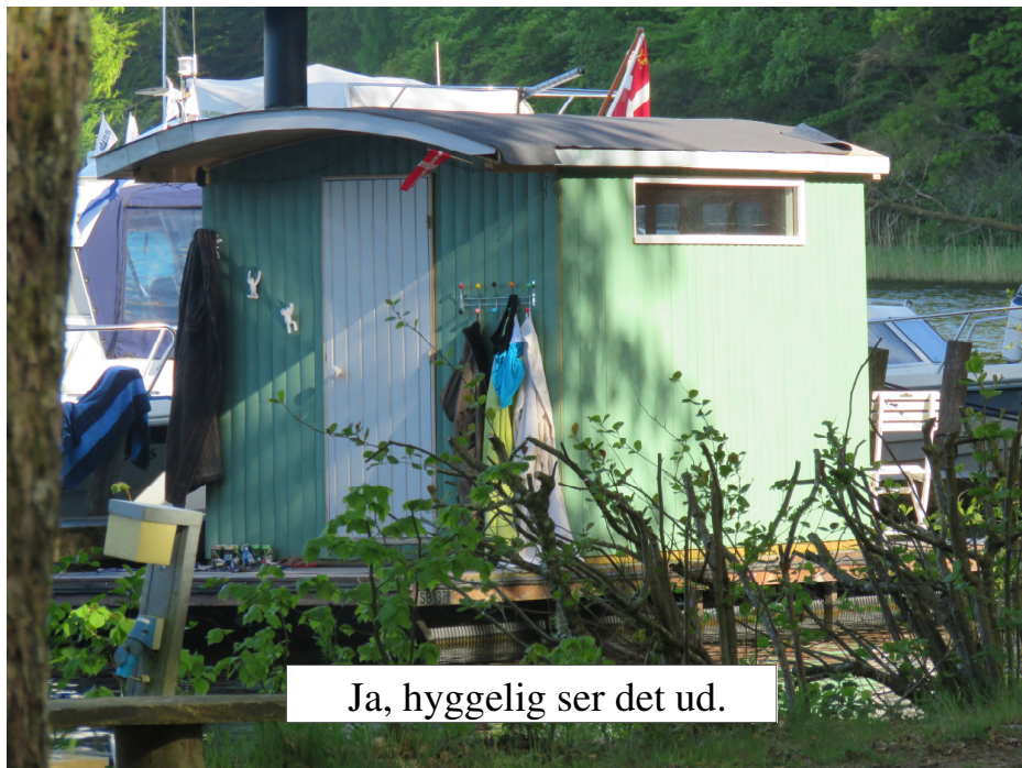
Ja, hyggelig ser det ud.