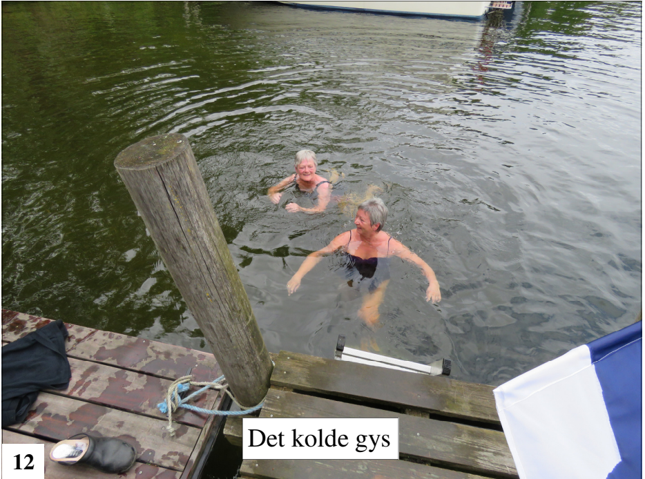
Det kolde gys