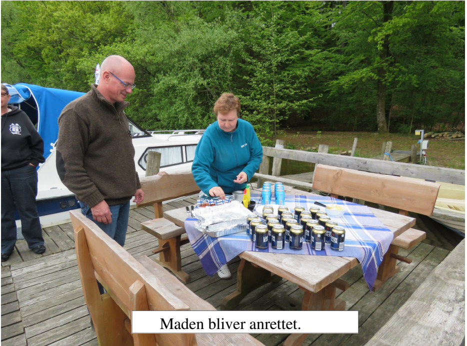
Maden bliver anrettet.