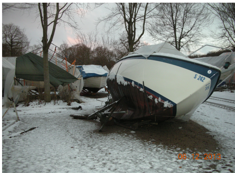
< Bodil kom forbi Indelukket >