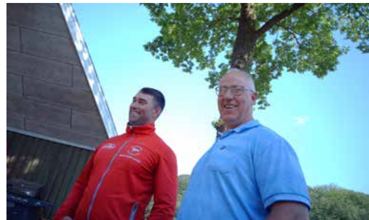
Hyggeligt at få en snak med naboerne.

lesskabet, klubben og faciliteterne, som er helt afgørende for at opnå de sportslige resultater.