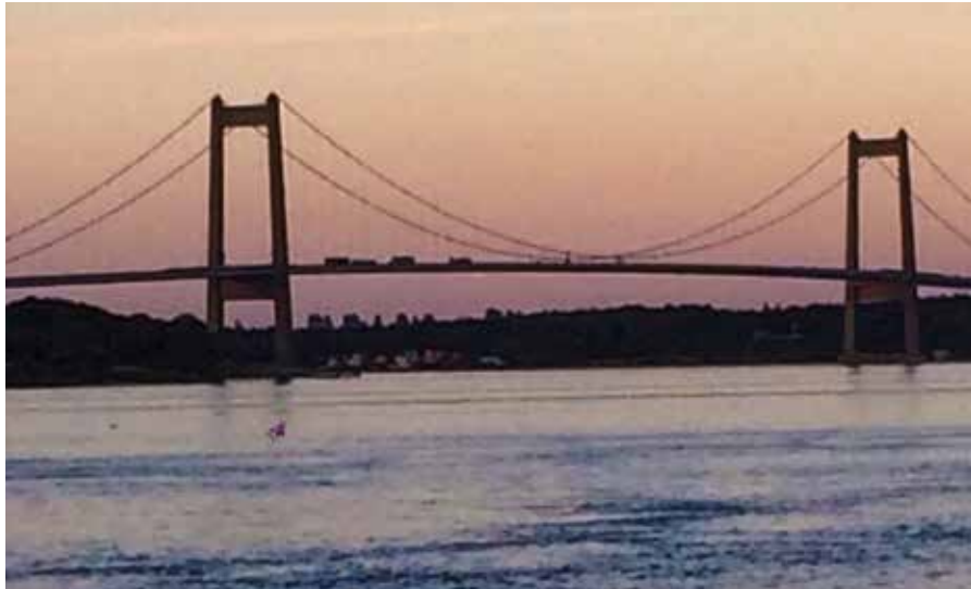
Den nye Lillebæltsbro i aftenstemning.

Fredag den 13/7 forlod vi Skærbæk Havn, som varmt kan anbefales. Med kurs mod Assens, hvor vi skulle have første overnatning i vores to ugers sommerferie.