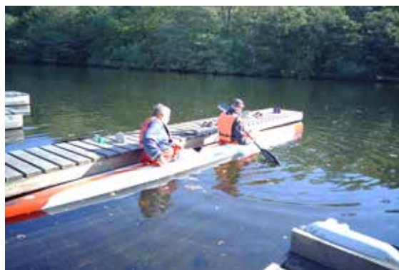
Seniorerne er i aktivitet på vandet om formiddagen

Som cheftræner i kajakklubben med de store resultater - og med ambitioner om at de skal være endnu større i fremtiden - arbejder han hele tiden med at optimere forholdene. Måltrettet og individuelt i forhold til den roer, der har blikket stillet ind på det øverste trin på sejrsskamlen - men også i forhold til fæl-