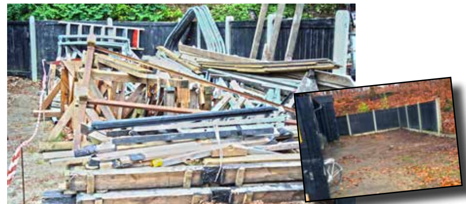
Materialegården er nu genetableret. Som det ses af billedet herover, er den straks blevet taget i brug, så der allerede nu er behov for en større oprydning for at sikre, at der er plads til alle. Indsat i billedet ses Materialegården i ryddet stand, umiddelbart efter genetableringen, Nøglen til gården forefindes i værkstedet, til højre for døren, oven over slibemaskinen.