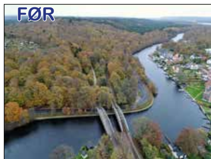
Jernbanebroerne i fugleperspektiv.

- Jernbanebroen er et kapitel for sig, for her spiller helt særlige sikkerhedshensyn ind, og der er mange forskellige