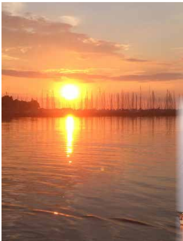
Både i Bogense.