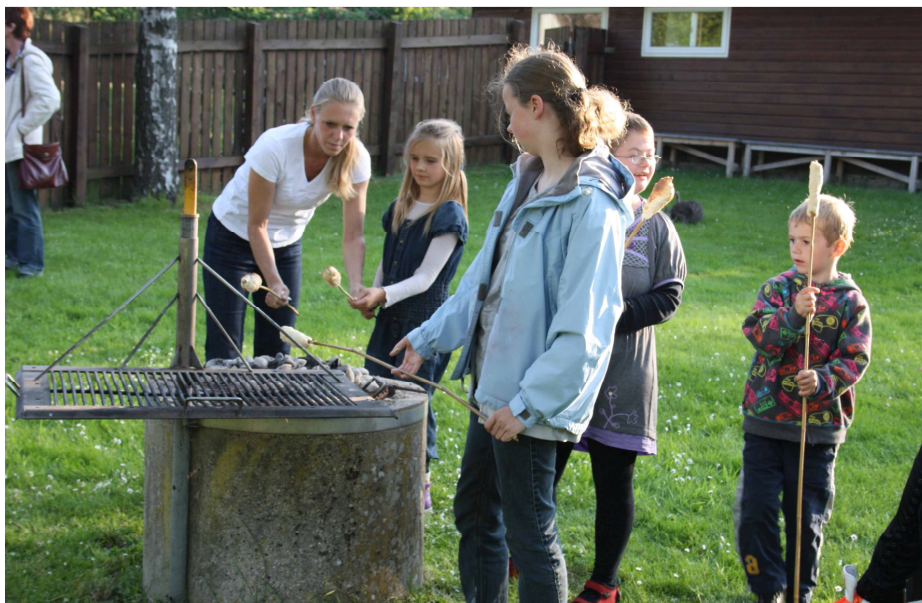
Børnene laver snobrød.

Der skal lyde en stor tak til arrangørerne af dette arrangement.