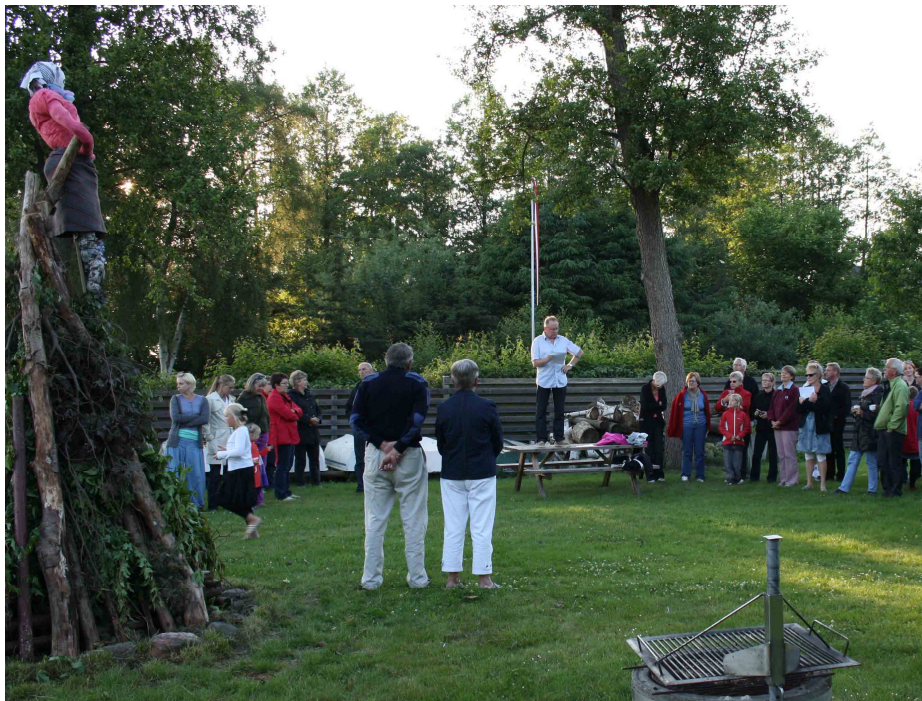
Sten holder årets båltale for de mange fremmødte.